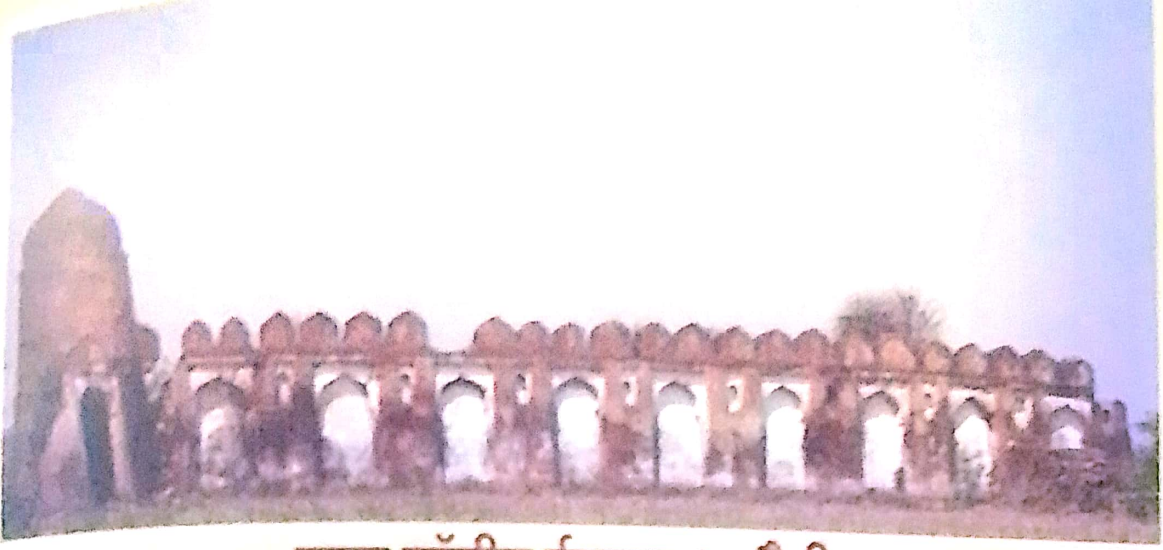
मुगल कॉलीन ईदगाह धामौनी