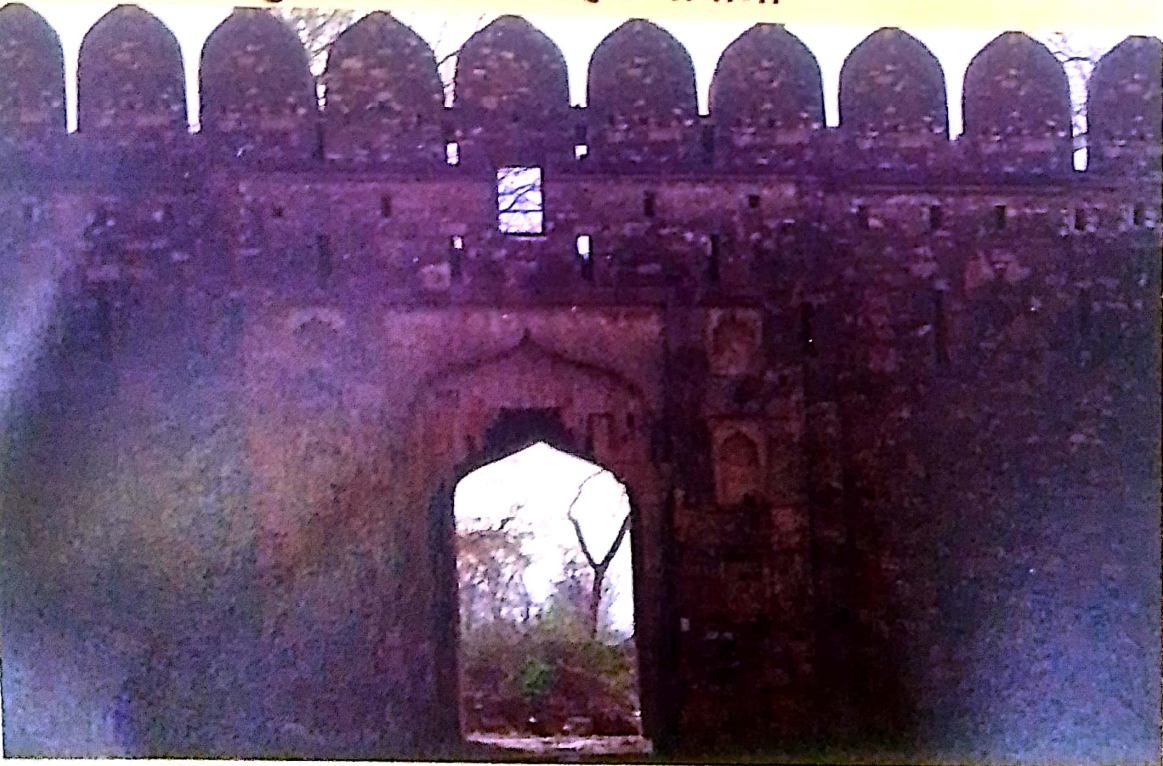
हाथी दरवाजा धामौनी दुर्ग