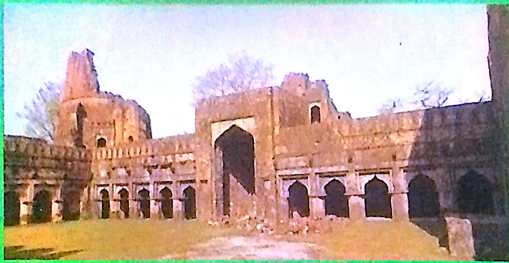
दुर्ग के अंदर बारहदरी एवं कोठरियां