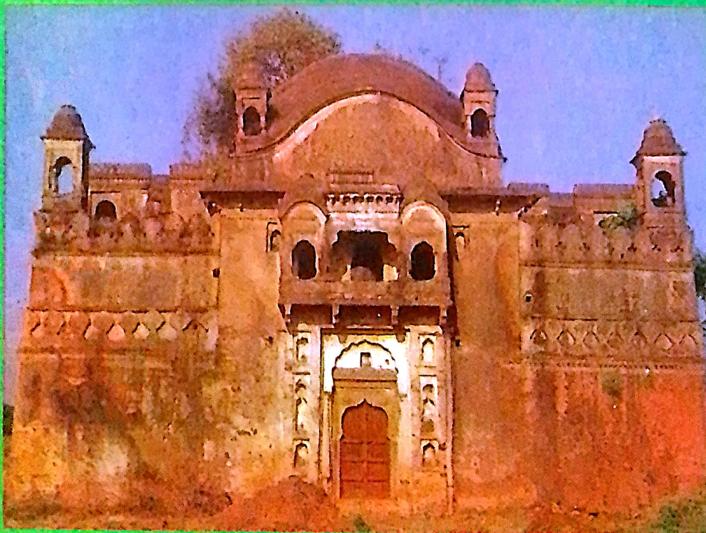
सलीम महल (वीरसिंह जूदेव काल)

डिजायन एवं मुद्रक - एक्टिव कम्प्यूटर्स, नमक मंडी, सागर 9826434225