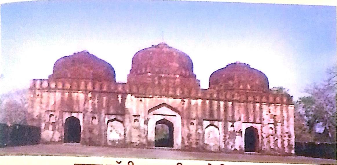
मुगल कॉलीन कचहरी धामौनी