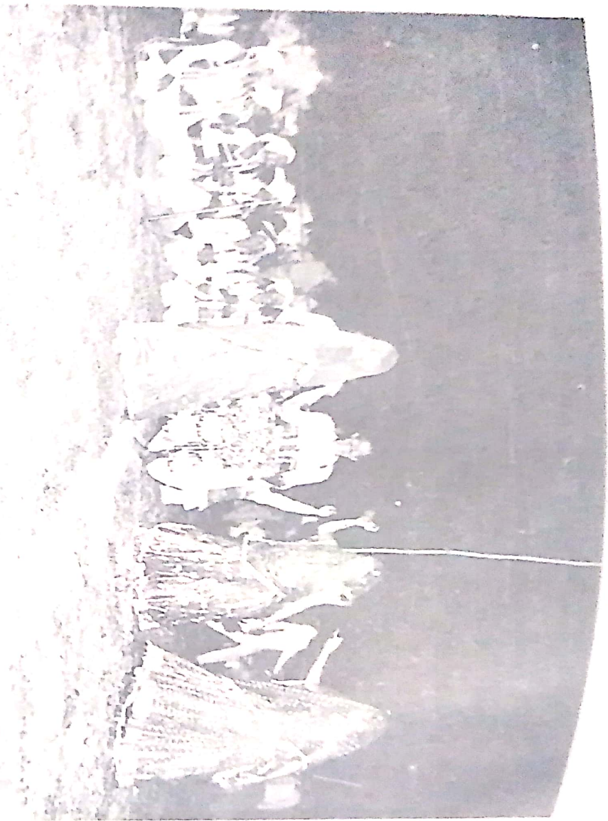
चित्र 28. सागर का लोक नृत्य—गई