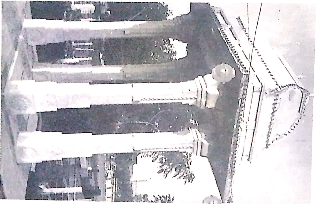
चित्र 33. डॉ. गौर का समाधि स्थान