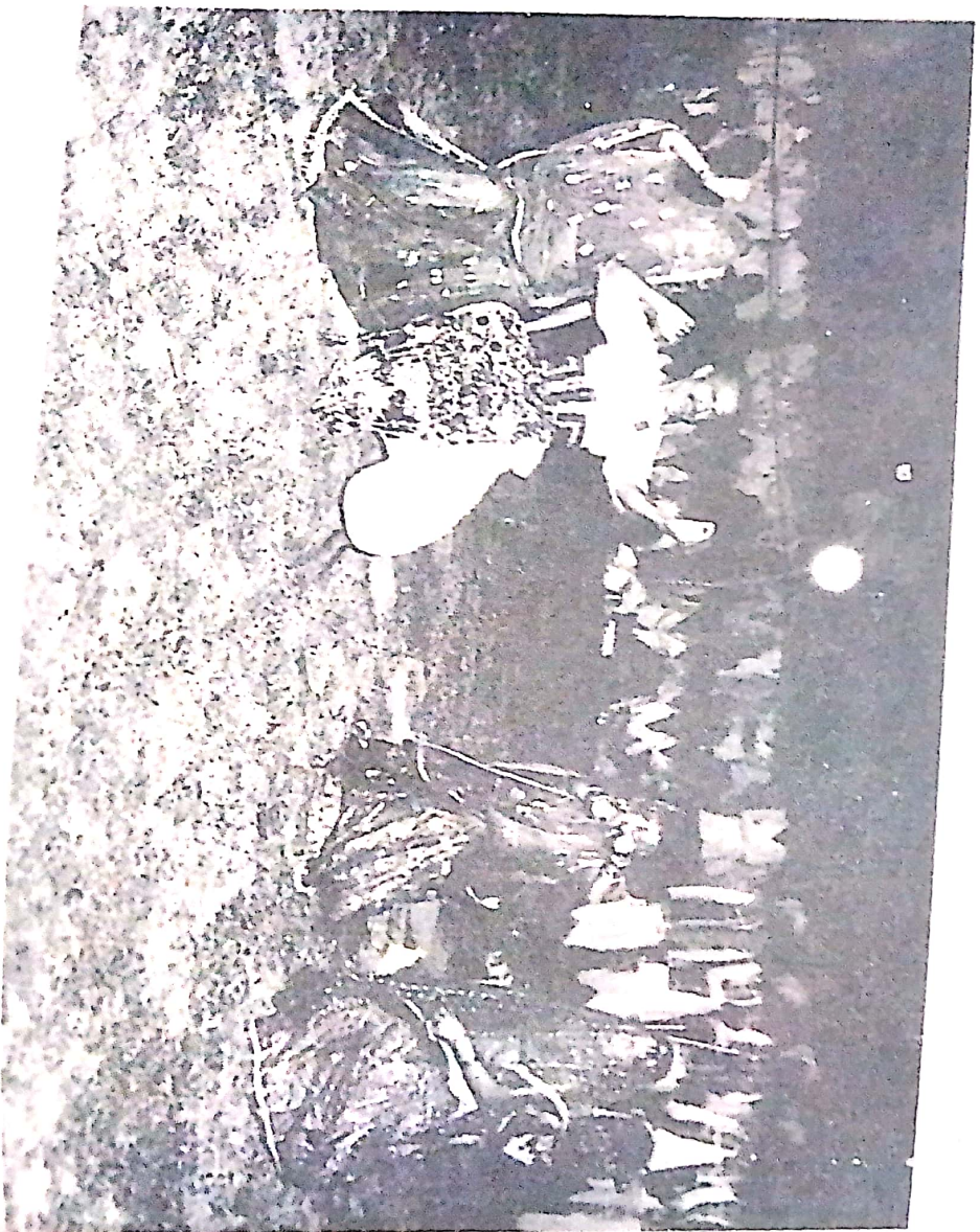
चित्र 29. सागर का लोक नृत्य—राई