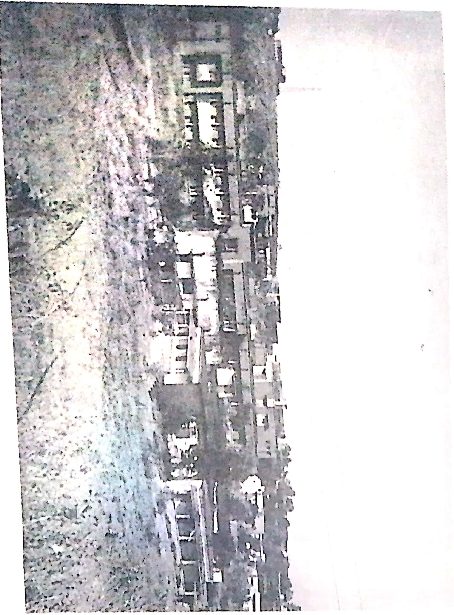
चित्र 35. सागर विश्वविद्यालय का विहंगम दृश्य