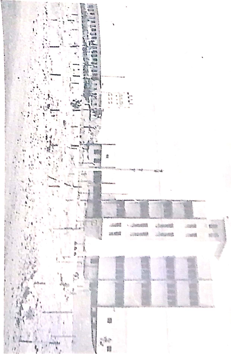
चित्र 34. चना टॉरिया निम्न उद्यान समूह